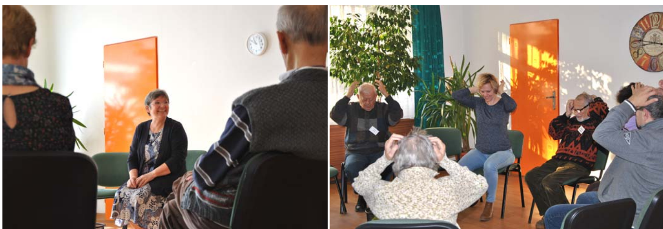
Dobrovoľníčky pri dobrovoľníckej činnosti v rámci programu Tréning pamäti a kognitívna rehabilitácia

Za rok 2016 sa vďaka iniciatíve SAS do dobrovoľníckych aktivít na pomoc ľuďom s Alzheimerovou chorobou zapojilo 36 dobrovoľníkov, ktorí odpracovali celkovo 1661 dobrovoľníckych hodín. Hodnota odpracovaných hodín (pri prepočte cez minimálnu mzdu) je 3 866 eur ročne (brutto), to znamená mesačne sme vďaka práci dobrovoľníkov ušetrili 322 eur.