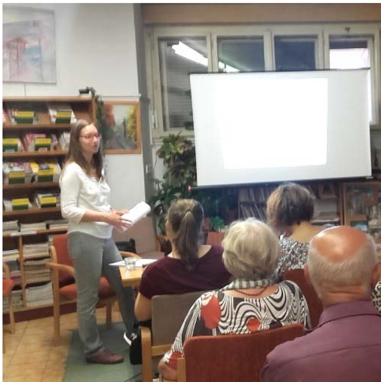
Prednáška v Staromestskej knižnici