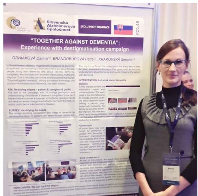
Prezentácia postera na konferencii Alzheimer Europe